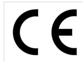
Logo Marquage CE

Les caractéristiques essentielles font l'objet d'une Déclaration des Performances (DoP ou DdP) et vont permettre d'apposer le marquage CE sur le produit (étiquette CE). La déclaration d'une performance relative à une caractéristique essentielle est obligatoire si cette caractéristique essentielle est réglementée dans le pays où le produit est mis sur le marché, ou si la Commission européenne en impose la déclaration, ou si elle est pertinente pour définir l'usage prévu du produit, ou si des informations concernant la performance correspondant à cette caractéristique essentielle sont communiquées, sous quelque forme que ce soit (par exemple dans une documentation technique ou commerciale, sur un site Internet,...) par le fabricant, l'importateur ou le distributeur.