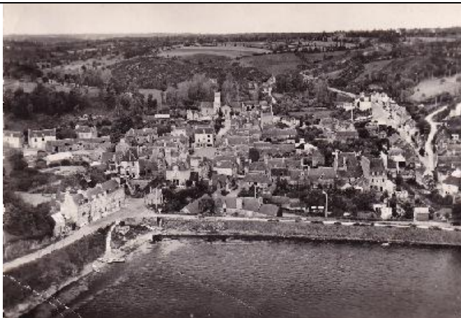
La digue de Jugon-les-Lacs