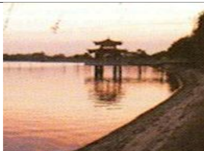
Le réservoir d'Anfantang il a été entretenu jusqu'à nos jours