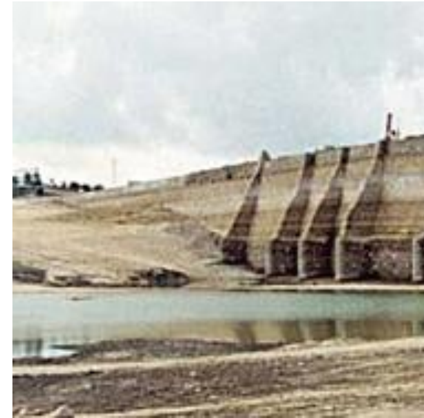
Vue d'amont du barrage.

Cette permanence d'un ouvrage sur dix-neuf siècles prouve la valeur et la flexibilité de l'aménagement, mais aussi le soin apporté à son entretien à travers les différentes époques.