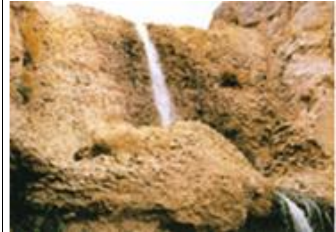
Kebar, premier barrage-voûte depuis l'époque romaine. Parement aval du barrage

L'un et l'autre servaient à la fois à l'irrigation et à l'alimentation en eau.