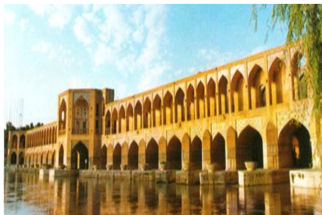
Le barrage-pont de Kadju