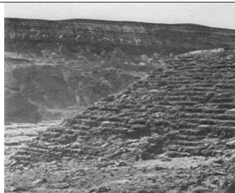
Sadd El Kafara, un ouvrage de près de 3 000 ans !

Cet accident dissuada pendant longtemps les Égyptiens d'édifier d'autres barrages. Il faudra attendre le règne de Sethi Ier pour que soit construit un autre ouvrage, cette fois en enrochement, sur le Nahr El Asi près de Homs. Haut de 6 mètres et long de 2 km, il est toujours en service de nos jours.