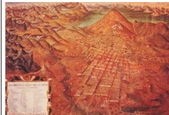
Potosi (Bolivie) des mines à perte de vue...

En 1621 , la rupture d'un de ces réservoirs provoqua la mort de 4.000 personnes, ce qui en fait une des plus grandes catastrophes de l'histoire des barrages.