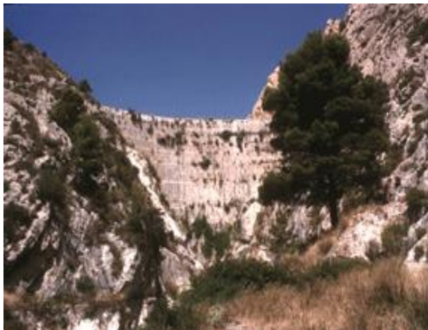
Tibi, le plus haut barrage au monde jusqu'en 1856